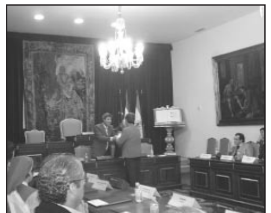
Aspecto del Salón de Plenos de la Diputación.