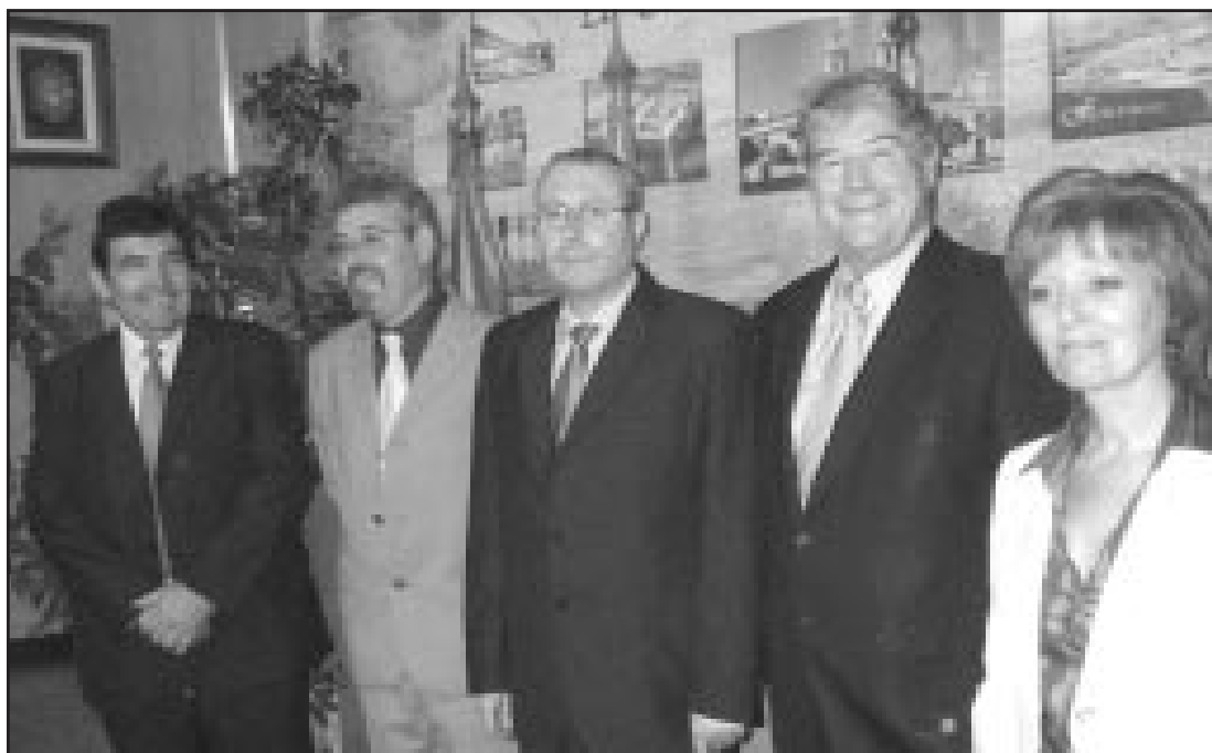
Foto de familia.

El Alcalde se mostró discreto en las referencias a la ausencia de autoridades provinciales y de la Junta y se limitó a ponderar la vitalidad del empresariado de la Colonia y el dinamismo de crecimiento que marca el carácter emprendedor de los colonos, que está colocando a Fuente Palmera en puestos de cabeza en casi todos los índices y pará-