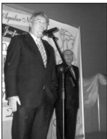
El Presidente de C.E.C.O.