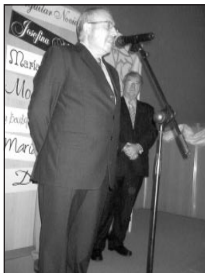
El Alcalde de Fuente Palmera.