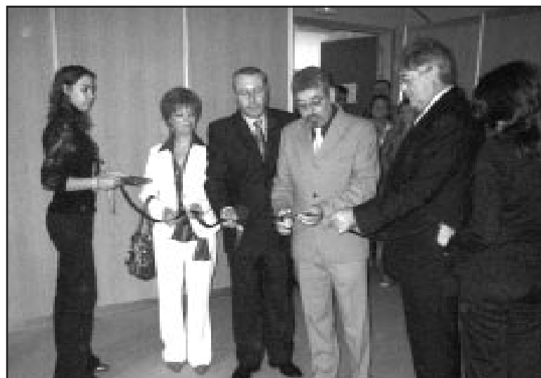
Momento de la inauguración.