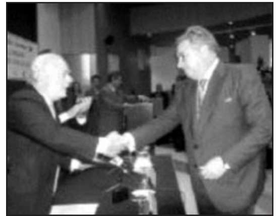
El director comercial de Martínez Barragán recoge el premio.

La empresa mantiene un fuerte movimiento de exportación y está presente no sólo con una planta y un secadero de jamones en Chile, sino que su actividad comercial se extiende por diversos países de Europa, como Alemania, Bélgica o Italia, y su mercado en expansión abarca